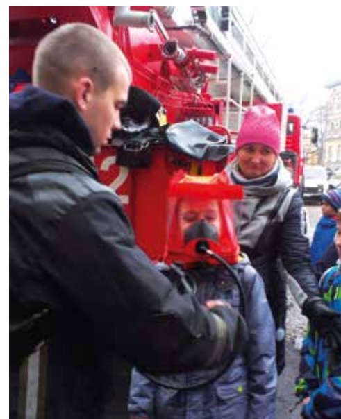
Фото и информация от Светланы Анатольевны Годлевской