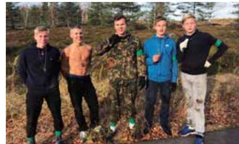
Наши на Дне призывника

— Мы получили отличный опыт и хорошо показали себя в командной