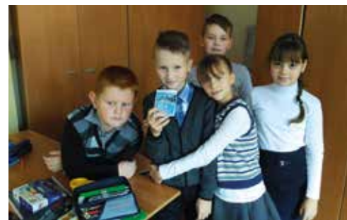
Зв на экоуроке

В игровой форме дети узнали о том, насколько важно биологическое разнообразие, о роли редких видов животных и растений в природных системах и о том, какие действия каждый из нас может предпринимать для их сохранения. Ребята отправились в увлекательное игровое путешествие- экспедицию для изучения редких животных. Первая группа «поехала» на Дальний Восток, вторая группа — в горы Саян и Алтая, третья группа путешествовала по Арктике. Затем каждая группа отчиталась по итогам своего путешествия. Ребята в группах разработали правила, которые смогут помочь. В конце урока ребята изготовили книжки-памятки «Сохранение редких видов животных и растений».