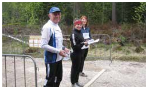
Старшая группа тоже готова