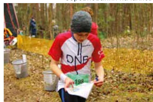
...можно и так