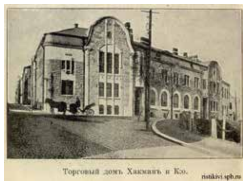
Торговый дом Хакмана и Ко.