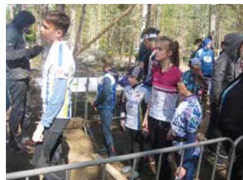
Все на старт