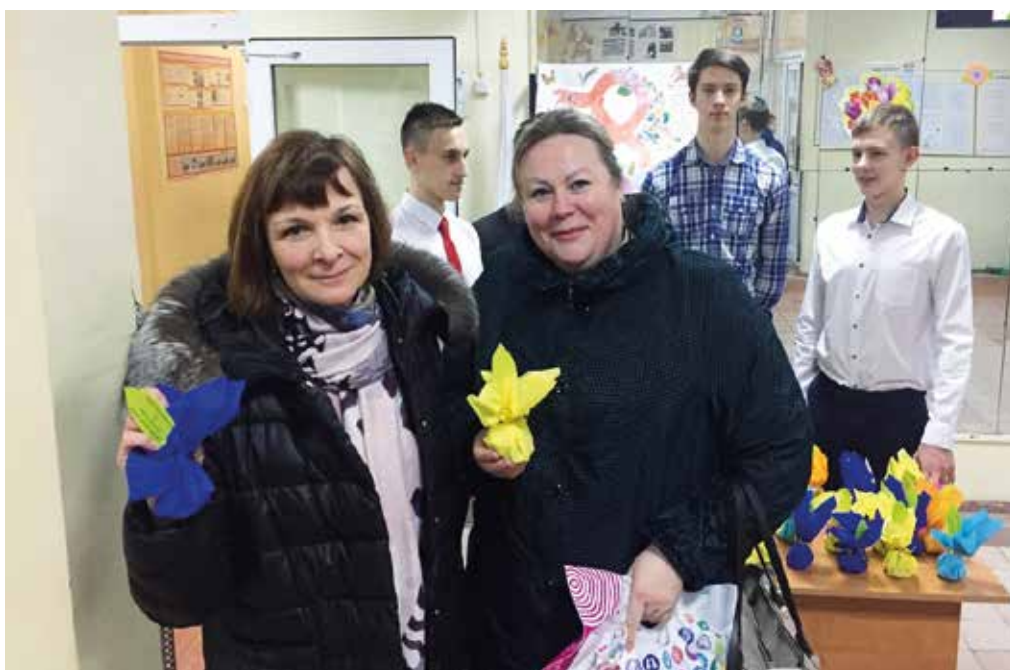
8 марта в школе

Накануне праздника активисты РДШ поздравили женщин, работающих в школе