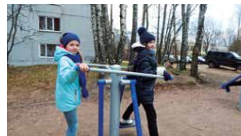
Свежий воздух всем полезен, он спасёт нас от болезней

тренажёров. Мы пока все перепробовали, какие только мышцы не потренировали! Но особый восторг — карусель. Спасибо Ивану, который так здорово нас всех раскручивал! Совершенно неожиданно мы набрали на недавно открывшуюся крытую площадку во дворе на Ленинградском шоссе между домами. 51-а 53-а. Здесь в любую погоду можно заниматься. Возвращались мы из разведки закалённые, оздоровлённые, думали, вот бы около нашей школы