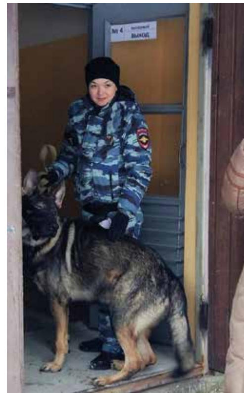
По сигналу тревоги