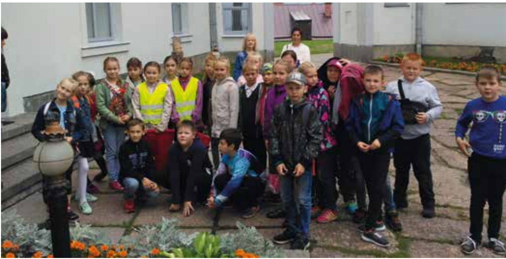
Мы в Выборгском Эрмитаже