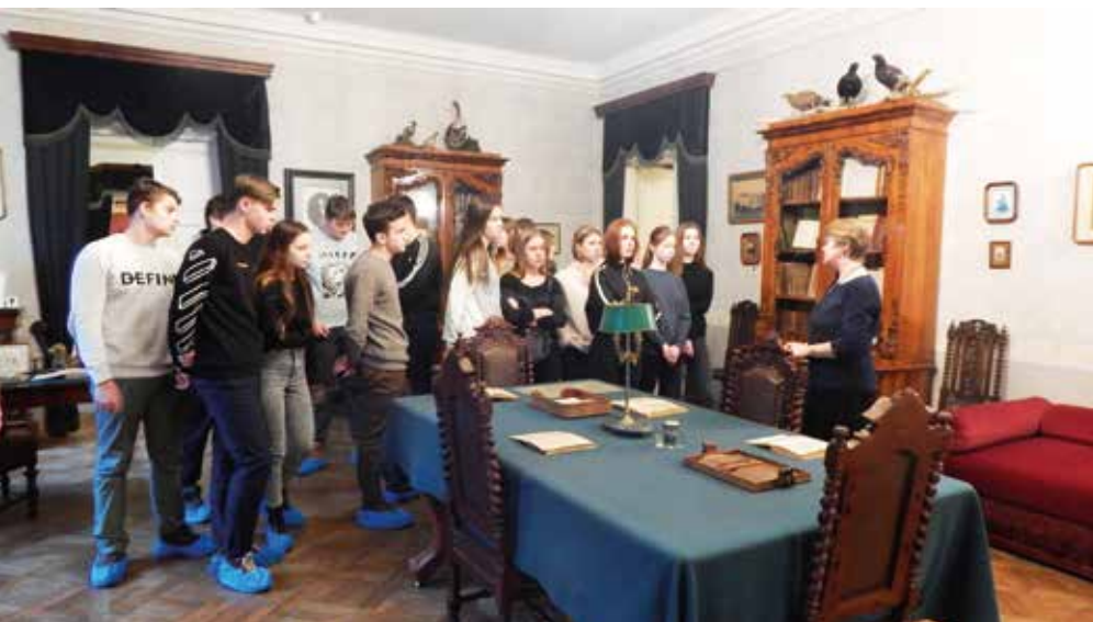
В редакции журнала «Современник»