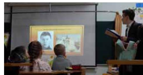
Об Александре Матросове

Дни воинской славы России 3 декабря — День неизвестного солдата 9 декабря — День героев Отечества