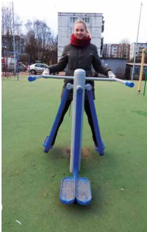
Если с физкультурой дружен, доктор никакой не нужен

Редакция школьной газеты «14 экспресс» пристально наблюдала за ходом строительства школьного стадиона, но в ожидании его открытия времени зря не теряла — искала места, где можно позаниматься спортом на свежем воздухе