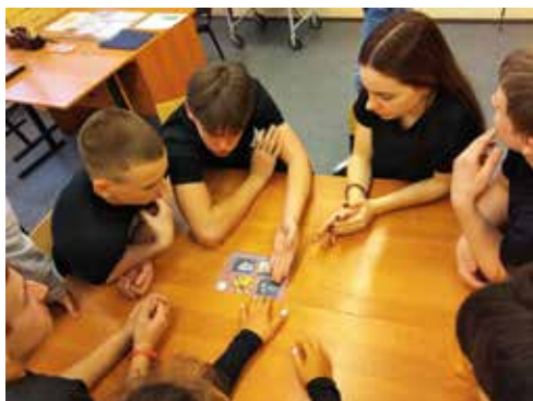
Команда 10а за работой

В этом году честь школы защищали ученики 10а класса. Все станции они прошли достойно, в итоге — почётное 3 место. Так держать!