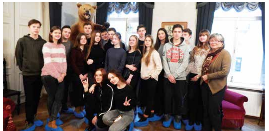
В гостях у Некрасова