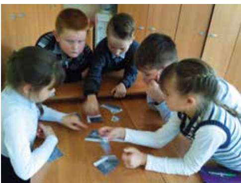
Работаем в команде