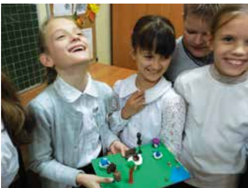
Мастера на все руки