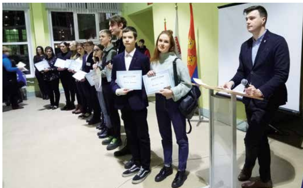
Наши на первом плане

Спасибо тренерам за интересную и полезную информацию, участникам за терпение и готовность познавать новое, а нашим ребятам