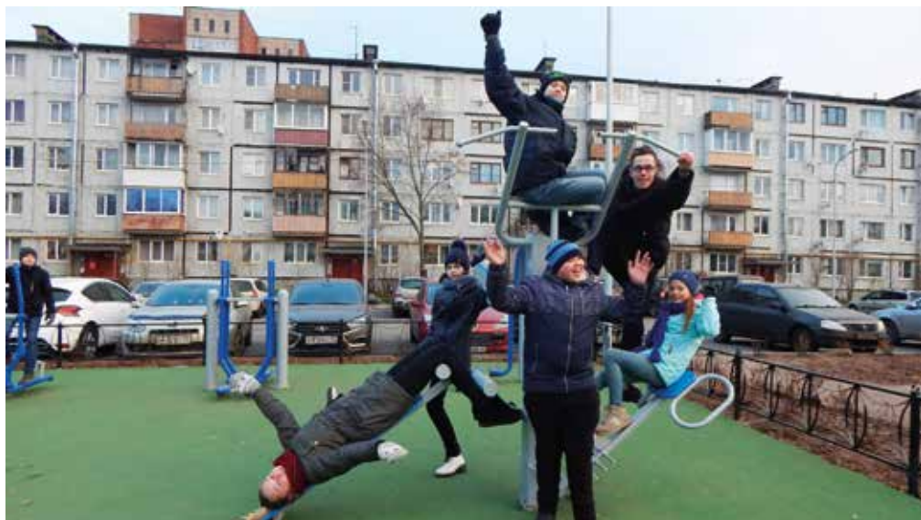
Полчаса на тренажёре — настроение в мажоре

Мы отправились в разведку, предварительно изучив положение дел. Первая остановка — Спортивная, 10, совсем рядом со школой. Всего несколько тренажёров, но заряд бодрости мы получили. Тем более, что познакомил нас с правилами работы на тренажёрах Мишка-Топотыжка. Он же показал нам дорогу к следующей площадке. Это недалеко от школы № 8, во дворах между улицей Сухова и Ленинградским шоссе. Здесь всё было впечатляюще. Настоящая карусель и много