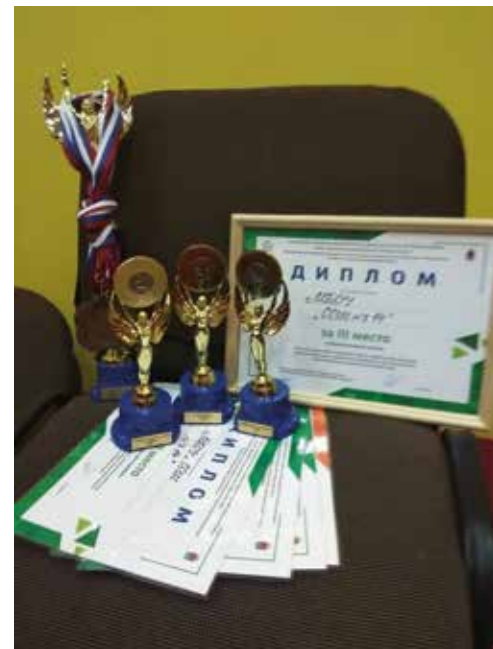
«Выбор. Молодость. Успех» Наши награды

14 декабря выпускники нашей школы узнали, что все успешно справились с первым испытанием и получили «зачёт» по итоговому сочинению. Молодцы!