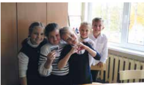
Мы любим 3б