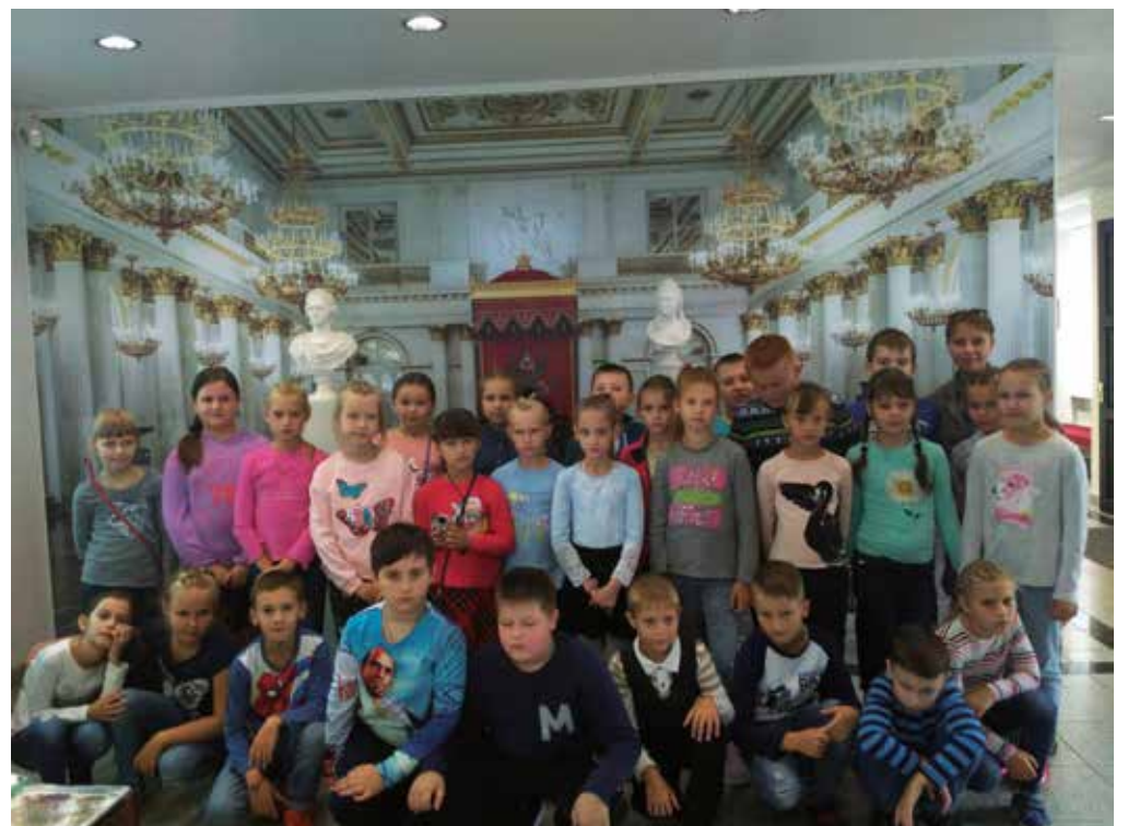
Любим ездить в Санкт-Петербург