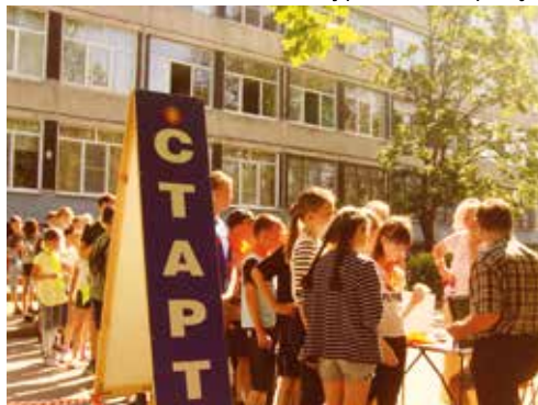
Международный Олимпийский день