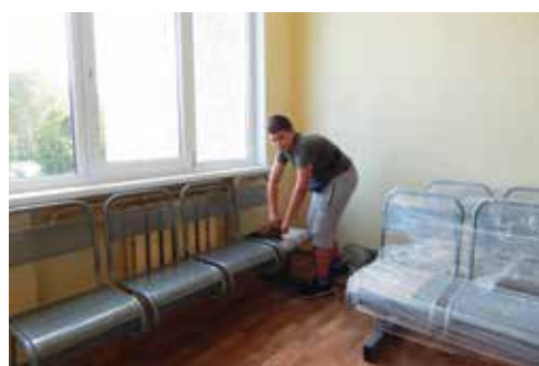
Путешествуем по школе