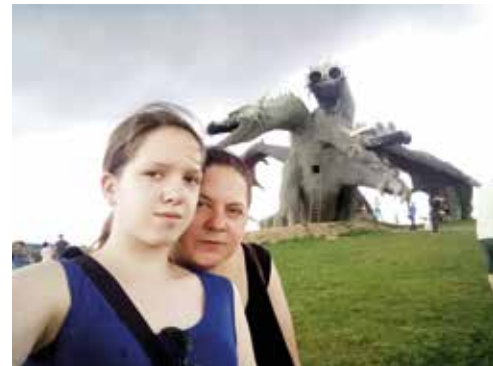
На Кудыкиной горе (Липецкая обл.)

И поэтому я точно могу сказать, что для меня, да и не только для меня, для любого ребёнка, минуты, которые мы проводим с родителями, — незабываемые.