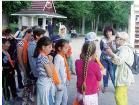
Экскурсия по городу

Играли на свежем воздухе, поливали цветы, девочки посещали кружок рукоделия, где могли научиться вышивать. Воспитанники узнали, как снимают фильмы. Проведены экскурсия по городу, флеш-моб, беседы по ОБЖ. Ребята принимали участие в твистинге (поделка) из шаров. Было много праздников, спортивных соревнований.