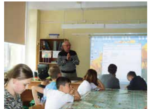
Как снимают фильм?