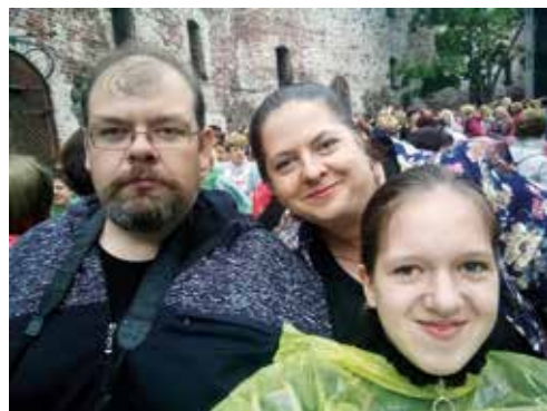
На фестивале «Мелодии трех морей» (Выборгский замок)

И я рада, что этим летом я проведу много времени вместе с моими родителями и любимой собачкой, путешествуя по России и в Крыму.