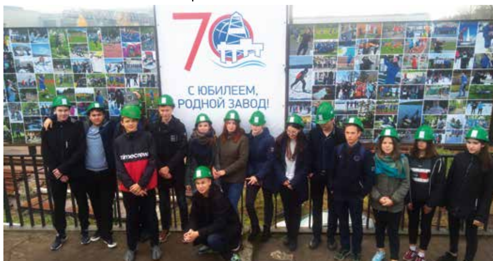
Мы тоже поздравляем коллектив ВЗЗ с 70-летием

Судостроительном Заводе, а одиннадцатиклассники в Управлении Внутренних дел.