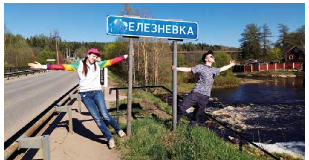
Самые активные летние корреспонденты