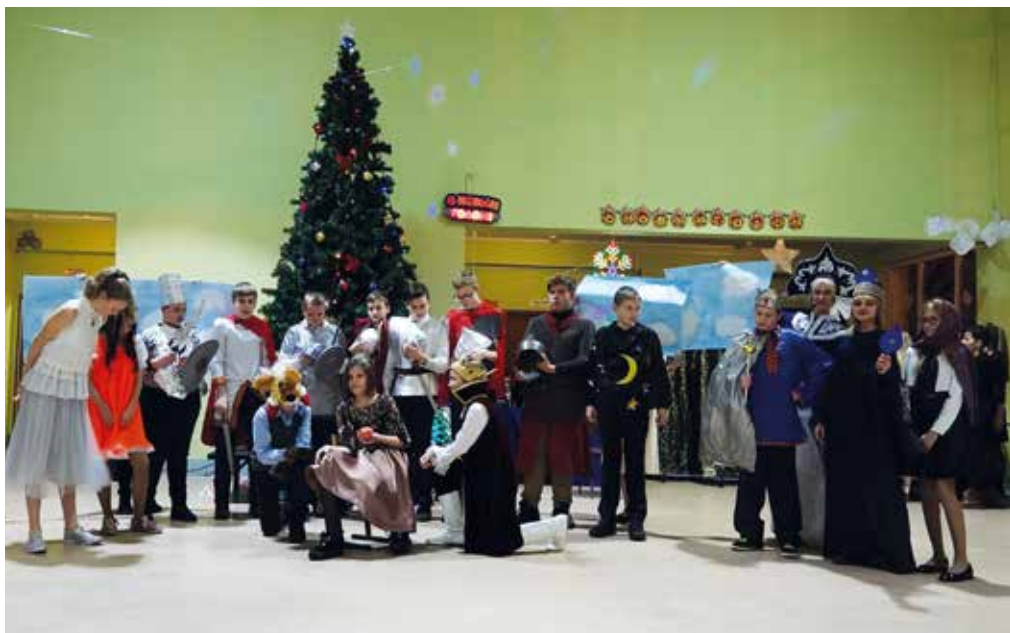
7б Сказка о мёртвой царевне