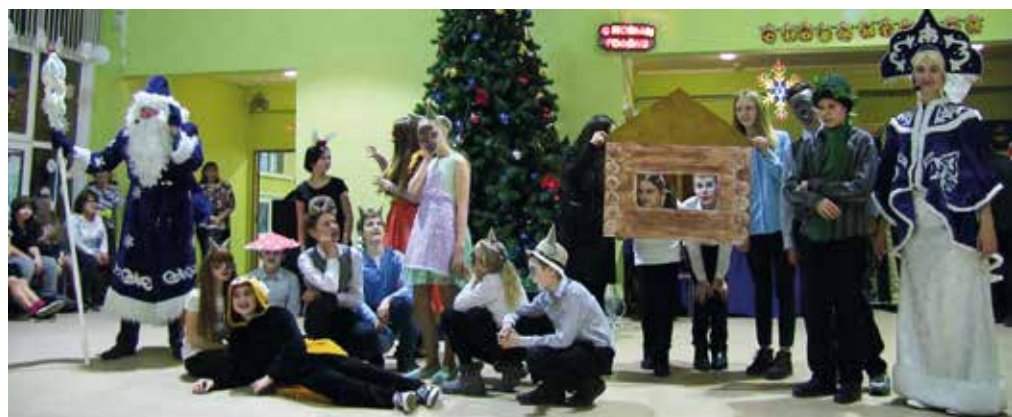
7в Волк и семеро козлят