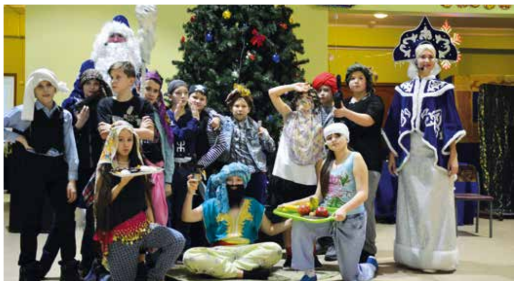
5а Али-Баба и 40 разбойников

На новогодней дискотеке каждый класс представил свою сказку Выбирайте лучших!