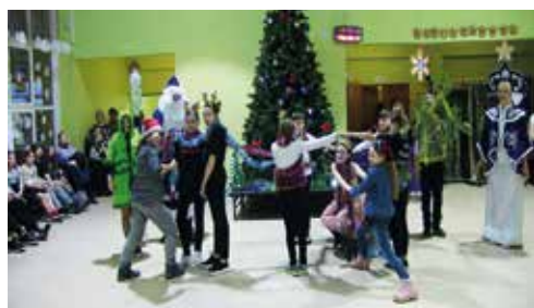
6г Снежная Королева