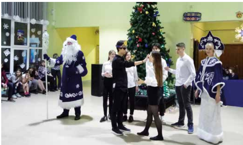
10а Сказание о царе Мидасе