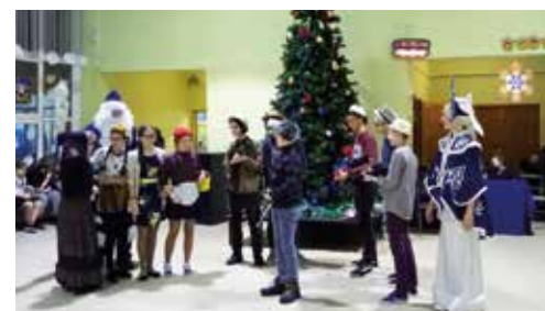
8б Красная Шапочка