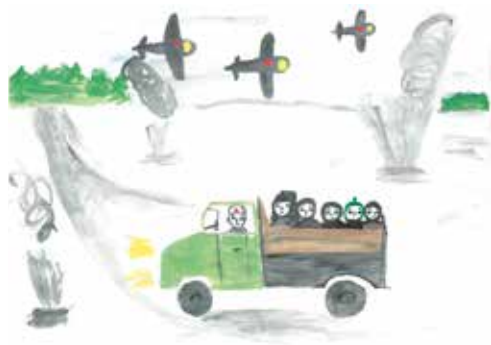
Тупека Наталья, 4а