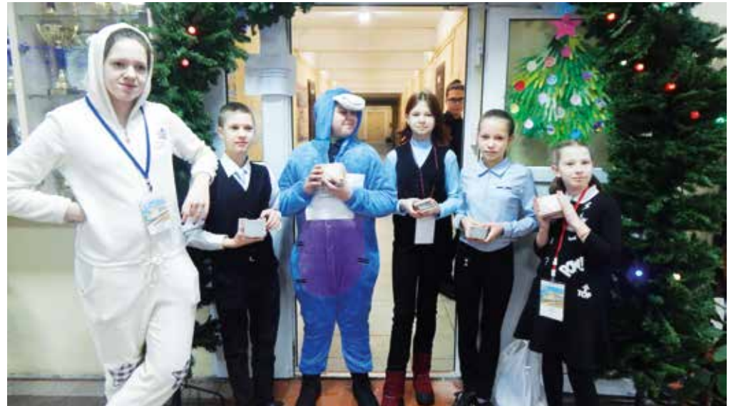
Школьный пресс-центр встречает учеников

По традиции, готовясь к Дню спасибо, наши художники создали эскизы для календарика