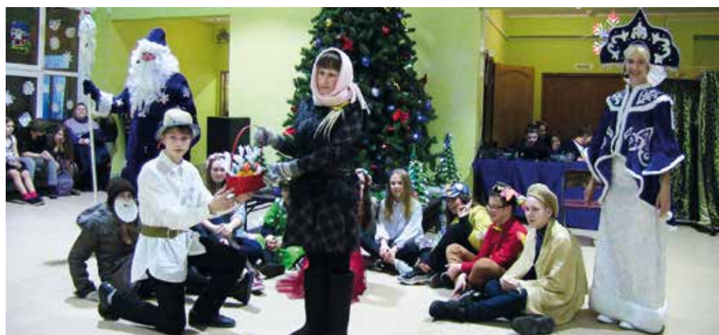
7а 12 месяцев