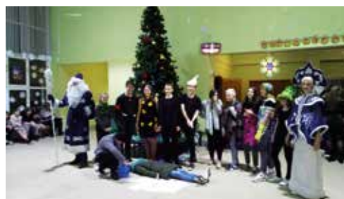
8а По щучьему велению