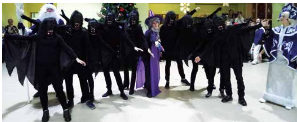
9б Волшебник Изумрудного города