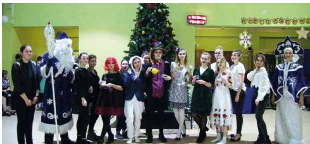
11б Алиса в стране чудес