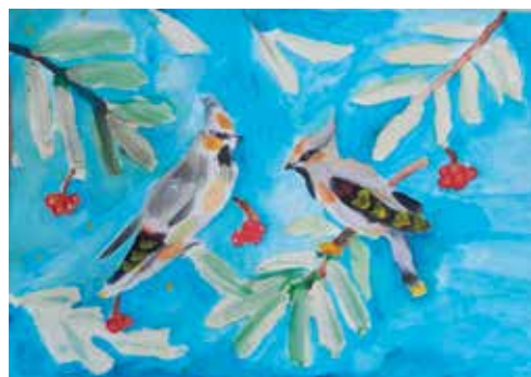
Дарья Максимова, 3а