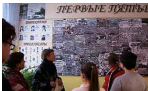
Вопросы задает пресс-центр

его в 4 классе, всегда помогали друг другу в учебе. А из коллективных дел вспомнил, как дружно собирали металлолом. Во дворе школы сарай был, туда со строек, со дворов несли ненужное (а иногда и нужное) старое железо. Бумагу тоже собирали. Всегда чем-то были заняты, без дела не сидели. Иногда выполняли то, о чем просили взрослые, а порой и сами что-нибудь придумывали. Скучать не приходилось.