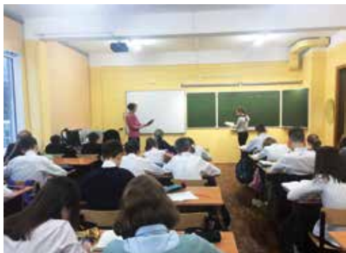
На уроке математики

Давайте заглянем в этот театр, на сцену и за кулисы, проживем один день вместе с нашей героиней.