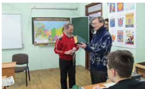
На встрече с десятиклассниками

О школе вспоминает с теплотой. Он учился еще в старом здании, на переменах, как и сейчас ребята бегали, веселились, зато на уроках — тишина, сосредоточенность. Понимали, зачем учатся. Актового зала не было, общие собрания проходили в рекреациях, праздники — в спортивном зале. В пионеры приняли