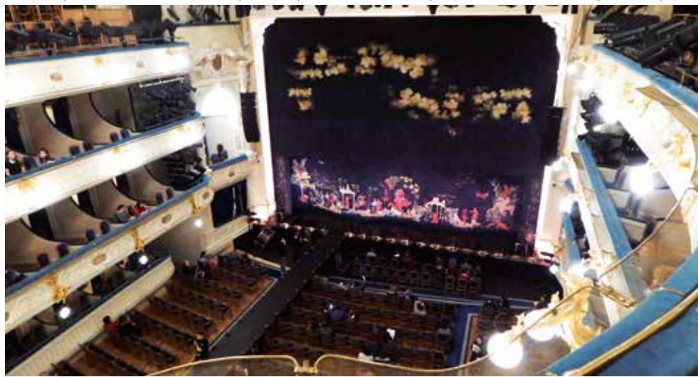
В БДТ «Гроза»

Все это увидели и мы, побывав в ноябре на этом спектакле. Войдя в зал, сразу обратили внимание на занавес, расписанный в палехском стиле, и протянувшийся через весь зал черный помост. Вера Марты-