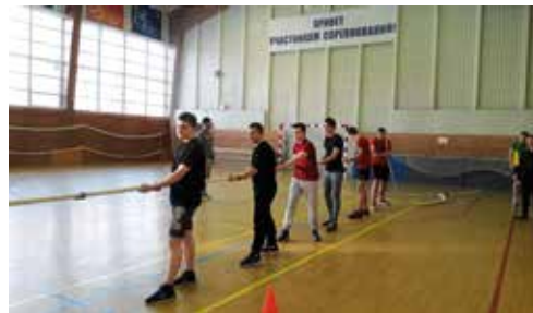
Юноши 10 класса. Готовность № 1

66 на связи: В нашей школе проходит акция «Армейский чемоданчик». Наш класс очень заинтересовался этим мероприятием. В пятницу были собраны вещи в наш самый насто-