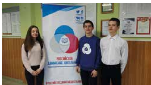
Наши на дебатах

Сначала для участников провели показательные дебаты, затем прошёл конкурс для выявления спикерских навыков. Потом учеников распределили на одинаковые по силам команды и провели два раунда.