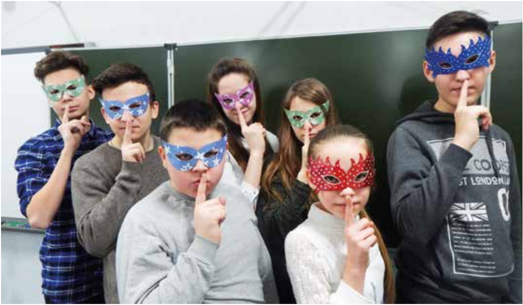
Театр — царство кривых зеркал. В нем тысячи масок и ни одного настоящего лица. Фаина Раневская

Понятно. Оперативно. Емко. Занимательно. Доступно. №10 (118), февраль 2019 года