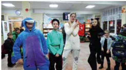
Утро в школе

Как на сцене, в школе есть и отрицательные герои, и положительные. Есть мало кому известные и играющие главные роли актеры. Актерская игра нам нужна и в школе. Мы притворяемся разными, а дома оказываемся совсем другими. Мы примеряем на себя чужие роли. Вежливый в школе ученик грубит родителям дома, или наоборот.