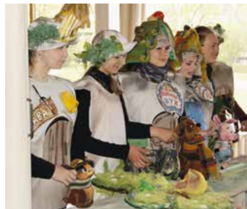
«Винни пух и все, все, все»

Театр. Многие не до конца понимают весь смысл этой культуры, считают скучным занятием. Но если вы так думаете, то вы уверены ли вы в том, что смотрели самый настоящий спектакль?